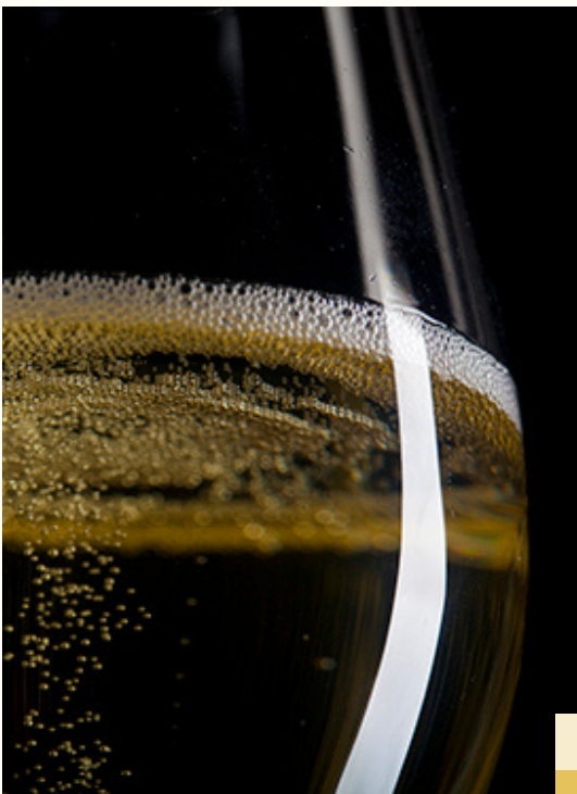
TABLE RONDE : BULLES - L'HISTOIRE SINGULIÈRE DU CRÉMANT DE BOURGOGNE