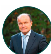
Olivier Poussier, Meilleur Sommelier du Monde 2000

L'accès à la master class est uniquement réservé aux inscrits confirmés par l'organisateur.