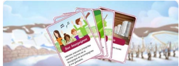
Les mots mystères