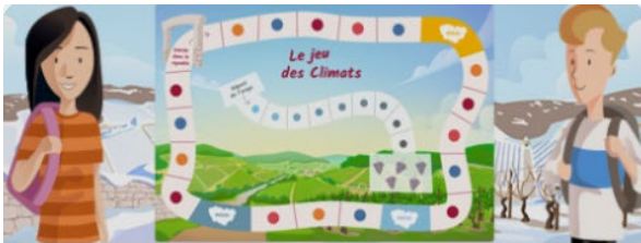
Le jeu des Climats