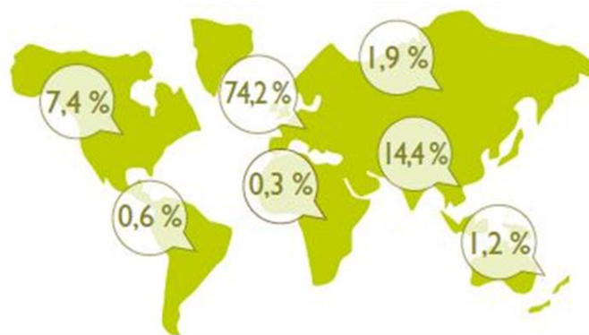
Répartitions par zone géographique des visiteurs en 2018