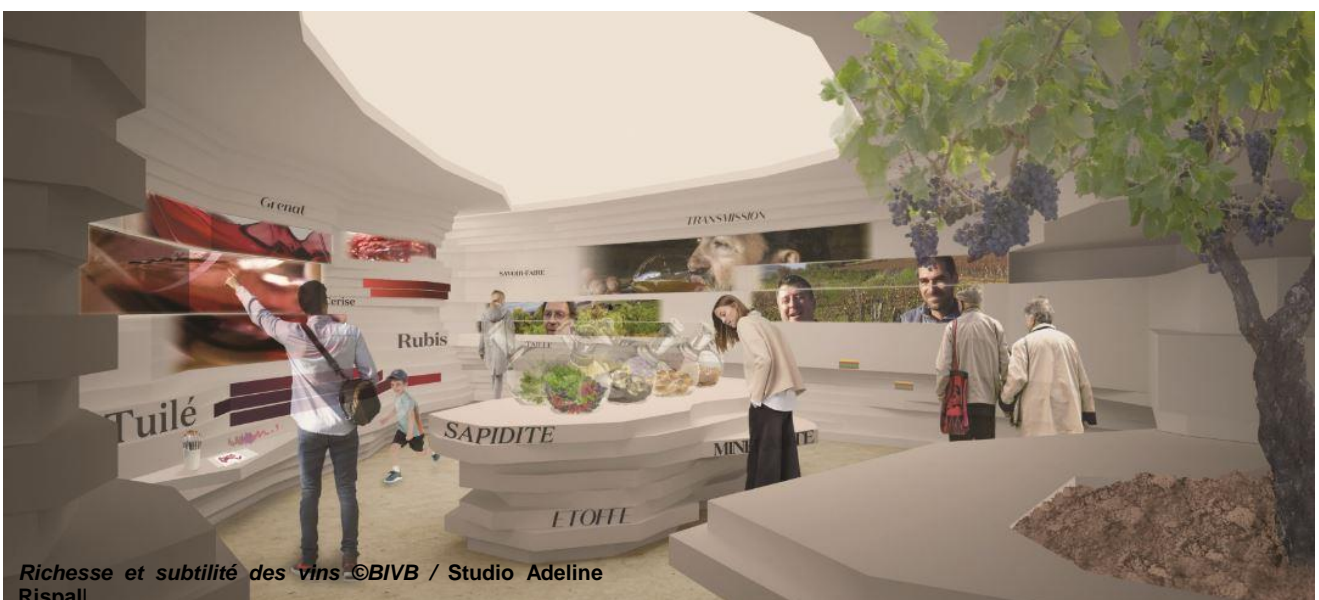
Richesse et subtilité des vins