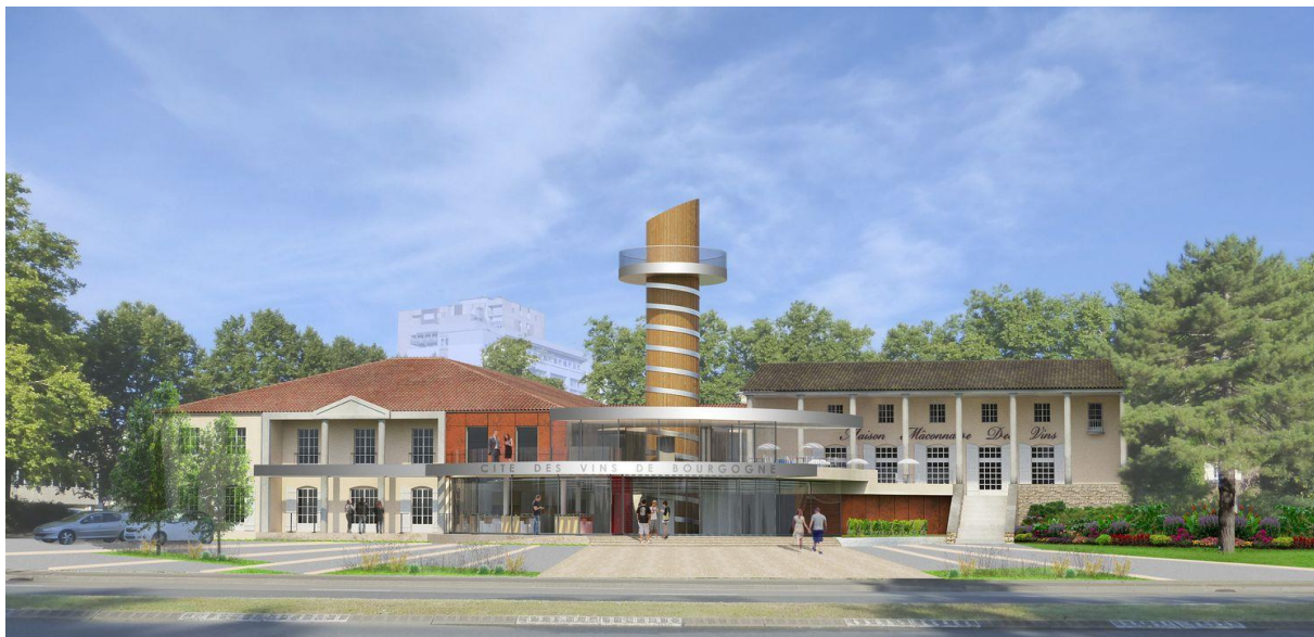
Projet de la future Cité des vins et Climats de Bourgogne de Mâcon © BIVB / RBC Architecture

RBC Architecture & ACL associés , cabinet basé à Mâcon, a été sélectionné pour mener à bien ce chantier.