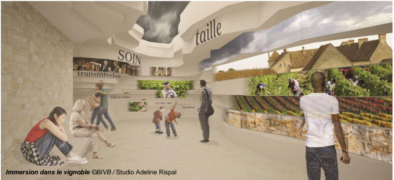
Immersion dans le vignoble