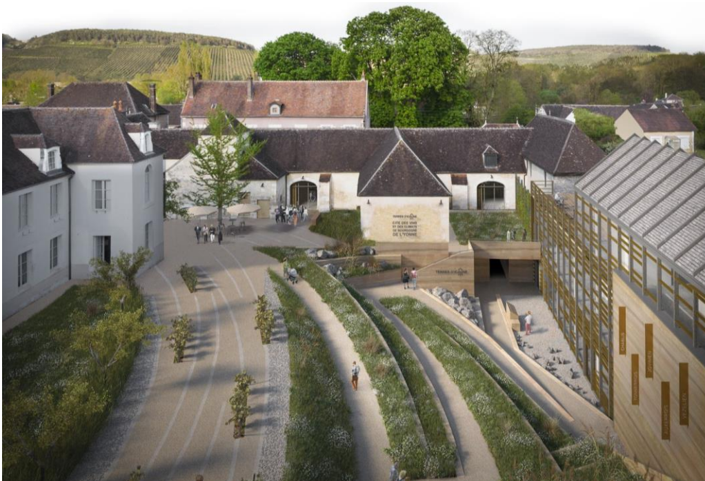
Projet de la future Cité des vins et Climats de Bourgogne de Chablis ©BIVB / Correia Architectes, Emmanuel Correia

L'Atelier CORREIA Architectes & Associés, situé à Saulieu au cœur du Morvan, a été retenu pour ce projet.