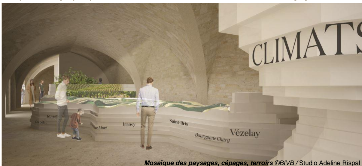
Mosaïque des paysages, cépages, terroirs