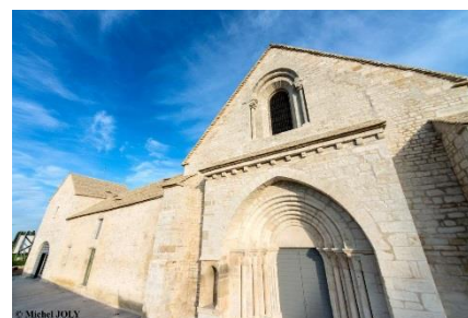
Léproserie de Meursault

Pour cette 14 ème édition, la Léproserie de Meursault , récemment rénovée, accueille la dégustation « Trinquée de Meursault ». Le Château de Gilly-les-Cîteaux , avec « Quatuor en harmonie », propose les vins des appellations Nuits-Saint-Georges, Chambolle-Musigny, Morey-Saint-Denis et Vougeot. Une dégustation consacrée aux vins Bios aura lieu à Rully .