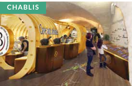
perspective d'ambiance, photo non contractuelle.