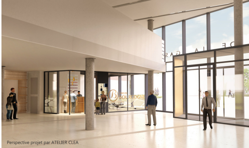
Perspective projet par ATELIER CLEA

Arrêt Tramway T2: Station Monge - Cité de la Gastronomie